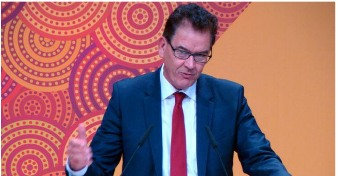
Bundesentwicklungsminister Müller beim 15. Internationalen Afrika-Forum

Afrikas Entwicklung muss nachhaltig sein. Das war die Botschaft des 15. Internationalen Afrika-Wirtschaftsforum, zu dem die Bundesregierung und die OECD eingeladen haben.