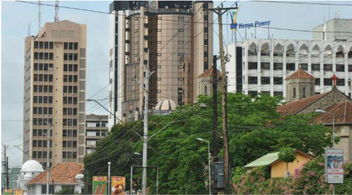
Nairobi in Kenia: Auch in Afrika wächst eine konsumfreudige Mittelschicht heran