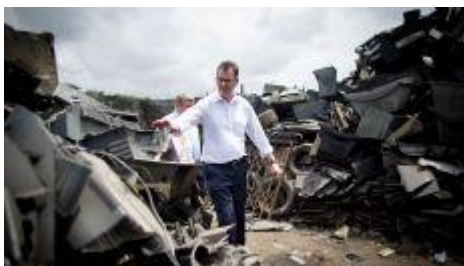
Müller inmitten von Elektroschrott in Ghana

Der beißende Geruch des brennenden Elektroschrotts auf einer riesigen Mülldeponie in der ghanaischen Hauptstadt Accra, schwere Armut in Liberia – Bundesentwicklungsminister Gerd Müller hat von seinen jüngsten Afrika-Besuchen bewegende Eindrücke mit nach Berlin gebracht, die auch die Agenda des internationalen Wirtschafts-Forums in Berlin bestimmen.